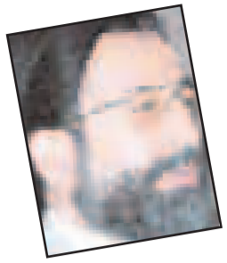
هیج کس بر ملت منتی ندارد