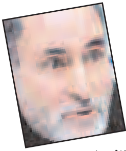
منافع ملی هر کشور تعیین کننده معیارها و روابط است