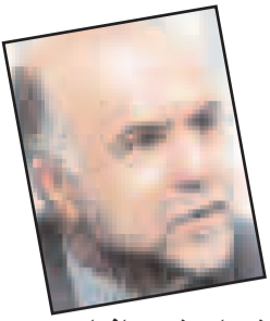
باندهای شبه مافیایی در اطراف وزارت نفت

آغاز بررسی لایحه اصلاح قانون انتخابات در مجلس