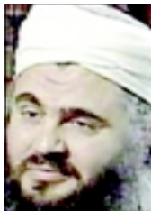
بازداشت سفیر القاعده

شبهه ۴ آبان ۱۳۸۱ - ۱۹ شعبان ۱۴۲۳ - ۱۲۶ اکتبر ۲۰۰۲ - سال دوم - شماره ۴۲۷ - صفحه ۶۰ - تومان