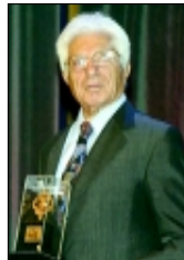
دانشمندان برجسته ایران