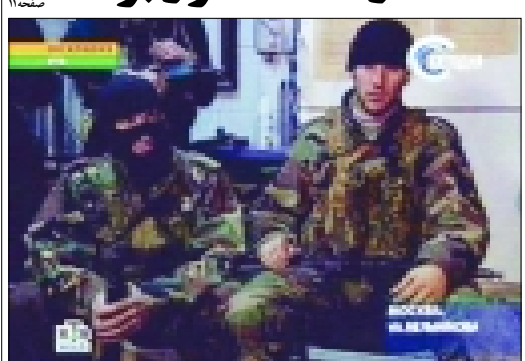
تولویون روسیه روز پنجشنبه تصویر تعدادی از گروگانگیران سالن تئاتر مسکو را نشان داد که فرمانده این گروه نیز در تصویر دیده می‌شود

خرازی، وزیر امور خارجه در رابطه با حمله نظامی علیه ایران: ایران از تصمیم سازمان ملل پیروی می‌کند