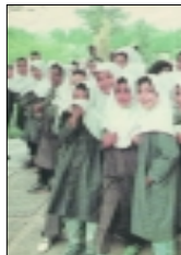
پوشش دانش‌آموزان دختر