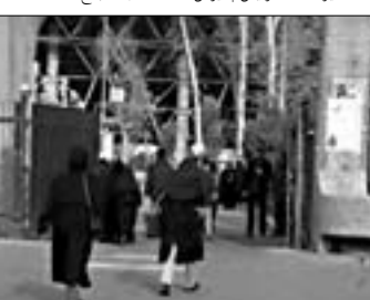
وزیر علوم افزود: به توجه به متنوع شدن درخواست‌ها برای دانشجوین پسر بودیم چنانکه در

افزایش یافته و به یک میلیون و هفتصد هزار نفر رسیده است. از سوی دیگر در سال گذشته به ۵۹٫۸ درصد بالغ شد.