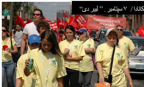
کانادا / ۷ سپتامبر. "لیبردی"

دوشنبه هفتم سپتامبر، به روال هر ساله، اولین دوشنبه ماه سپتامبر، هزاران نفر از کارگران کانادا و اتحادیه هایشان راهپیمایی کردند و این روز را گرامی داشتند. در تورنتو دهها اتحادیه کارگری با بنر و پرچمهای خود و به راه انداختن تظاهرات خیابانی بخشهای زیادی از خیابانهای اصلی تورنتو را برای ساعتها بسته و راهپیمایی کردند، شعار