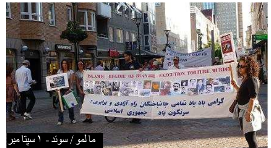
مالمو / سوئد - ۱ سپتامبر

سوئد- روز سه شنبه اول سپتامبر شهرهای گوتنبرگ و مالمو سوئد شاهد برگزاری مراسم یادمان زندانیان سیاسی کشته شده بدست جمهوری اسلامی در مراکز پر رفت و آمد این شهر هابود. در گوتنبرگ سن این مراسم با باندرول هایی