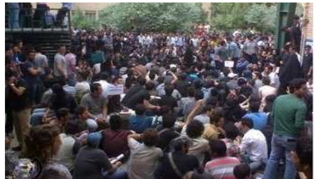
دانشجویان دانشگاه آزاد در پنجمین تجمع اعتراضی خود

کارگران لوله سازی خوزستان طی روزهای گذشته در چند نوبت دست به تظاهرات زدند و با سر دادن شعارهایی نظیر مرگ بر دیکتاتور، مرگ بر سرمایه دار، خواهان پرداخت ده ماه حقوق معوقه خود شدند.