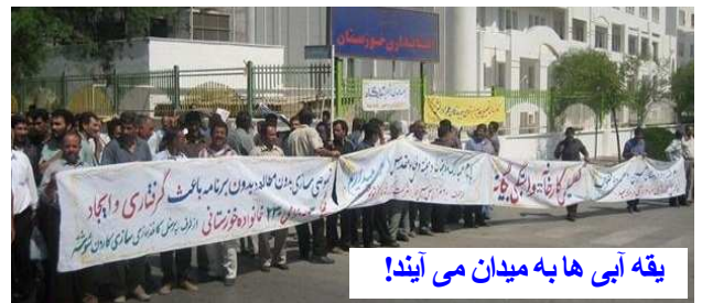
يقه آبی ها به میدان می آیند!